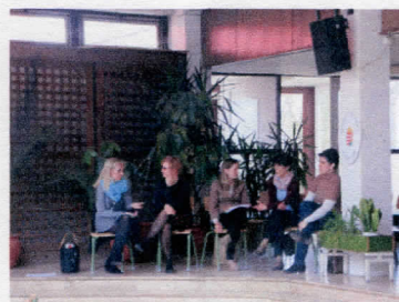
A felkészítő tanárok szakmai beszélgetése

A gyerekeknek a következő típusú feladatokat kellett megoldani: