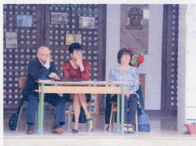
A zsűri tagjai