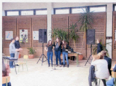
A BÉBÉ csapat önálló feladata