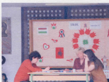
A feladatok javítása